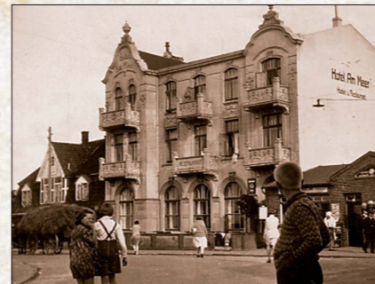
Hotel am Meer

Im unteren Bereich wies der Brunnen eine quadratische Form mit einer Kantenlänge von 1,30 Meter auf, darüber eine kreisförmige Form mit einem Durchmesser von 1,25 Meter. Der Cuxhavener Vor- und Frühgeschichtsforscher Karl Waller (1892–1963) grub die Anlage aus und veröffentlichte seine Erkenntnisse in einem Zeitungsartikel in der Cuxhavener Zeitung vom 24. April 1935. Der obere Teil des Brunnenschachtes wurde aus Sandstein rekonstruiert und mit einem strohgedeckten Dach überspannt. Der Dorfbrunnen gab dem ihn umgebenden Gemeindeplatz seinen heutigen Namen (Am Dorfbrunnen). Er war am 23. Juni 1935 eingeweiht worden und gilt als Wahrzeichen Duhdens. Am 14. Juli 2005 ist der Dorfbrunnen saniert und mit einem neuen Reetdach versehen worden.